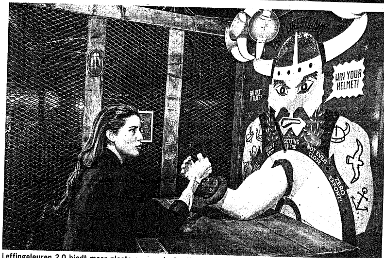
Leffingeleuren 2.0 biedt meer plaats aan randanimatie.